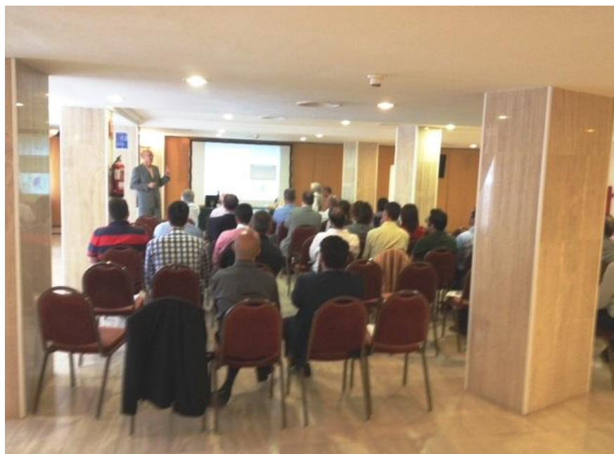
Jornada en Las Palmas de Gran Canaria