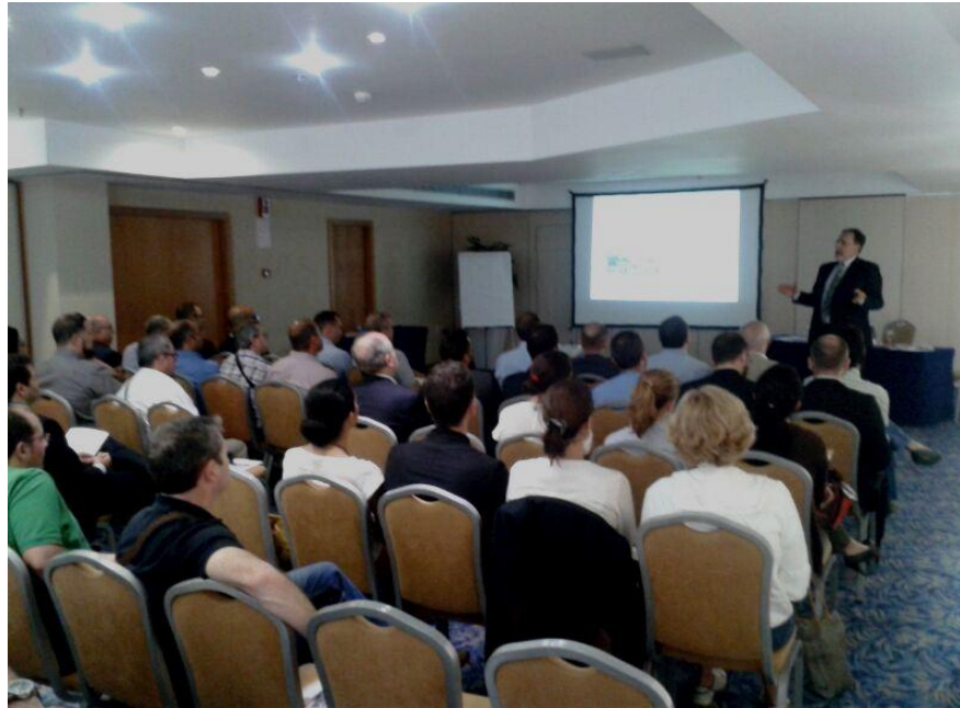
Jornada en Santa Cruz de Tenerife

La finalidad de estas Jornadas, no ha sido otra que la de dar a conocer la importancia y los fines de la Investigación de Incendios y Explosiones a los profesionales asistentes, pues entendemos que de esta forma, cuando se les presente en su andadura profesional esta clase de Siniestros, tengan la suficiente información como para poder determinar la necesidad o no de solicitar su investigación especializada a sus Compañías Aseguradoras, Clientes, etc., al ser ellos sus ojos ante tales siniestros.